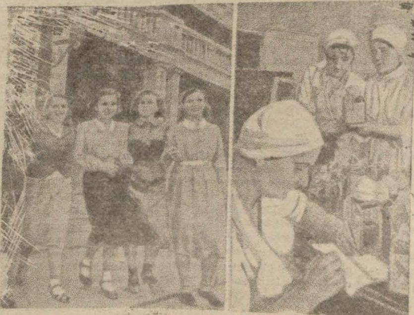
Cephedeki yaralı askerlerin büyük bir kısmı kan ziyandan ölmektedirler. Yukarıdaki resim, Sovyetler Birliğinde kan verme enstitüsüne gönüllü olarak kan vermek üzere müracaat eden genç kızları ve kanları sterilize şişelere dolduran enstitünün faaliyetini gösteriyor

[Yazısı 4 üncü sayfanın 5 ve 6 inci sütunlarındadır]