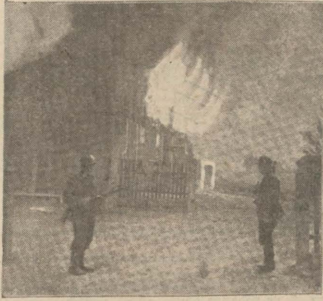
(Solda) işgal edilen bir Sovyet şehrinde yanan ahşap evlerin önünde nöbet bekleyen Alman askerleri, (sağda) nakliyata mâni olmak üzere bir köprüyü bozan Alman öncüleri

Tek ve çift numaralı bütün taksilerdeki gibi seyruşer etmeleri hakkındaki Koordinasyon kararı, bu hususta emirname henüz alâkadarlara tebliğ edilmediğinden tablik sahasına koymuş değildir. Buna rağmen bazı taksilerimiz, bu sabaktan itibaren tek ve çift numaralı taksilerin sefere çıkması hakkında iseler de, bugün de eski vaziyete göre tek numaralı sefero kullandıklarını belirttik.