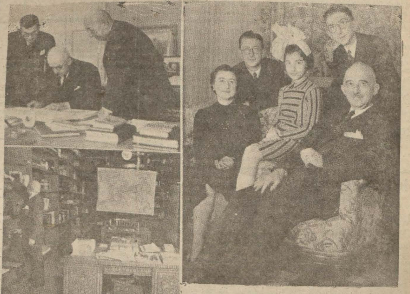
Amerikan mecmuasında çıkan resimler

Dünyanın en maruf ve en çok okunan mecmualarından Amerikan Life mecmuası son nüshalarının birinde iki sayfasını Türkiye'ye tahsis etmiş ve bu münebbetle yukarıda neşrettiğimiz Millî Şefe aid üç